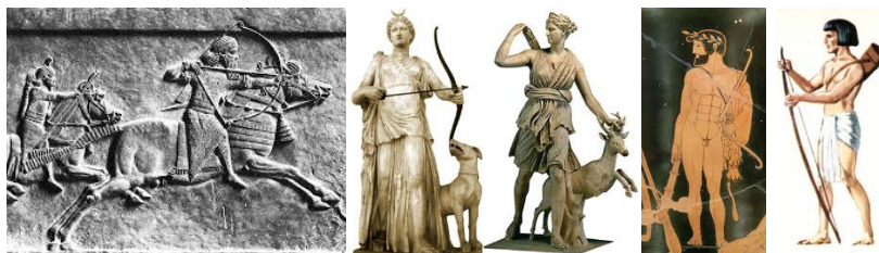
Les étrusques les grecques et les égyptiens