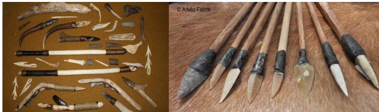
Peintures rupestres et armes préhistoriques