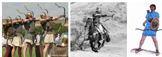
Les Romains, en Iran, en Crète