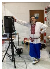
Le Capitaine en DJ

Un cadeau par jour pour le déguisement le plus original