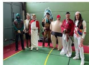
Ste-Geneviève-des-bois ont joué le jeu