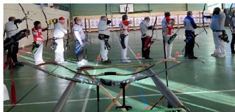
Il y a quand même des tirs et des bons scores